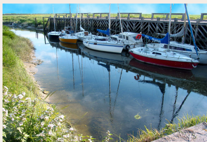
Port de la Madelon