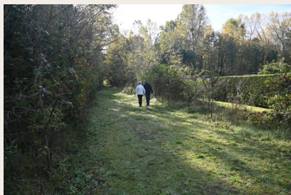
L'Allée des Roses

L'Allée des Roses reliait autrefois les "châteaux" Delesalle et Elby. Anciennement bordée de rosiers, elle est désormais propriété du Conservatoire de l'Espace Littoral et des Rivages Lacustres. La petite boucle (1,5 km) qui porte son nom permet d'apprécier la variété du paysage en passant graduellement de la dune blanche à la dune grise puis arbustive