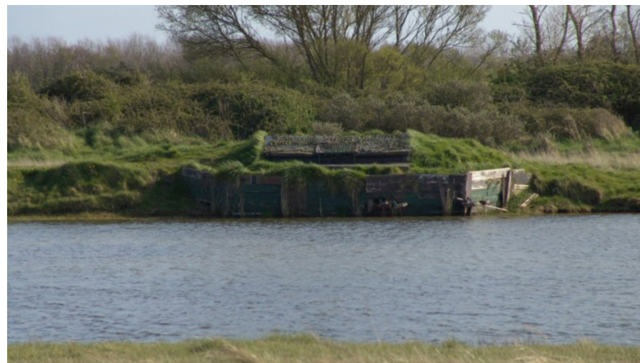
Hutte de chasse