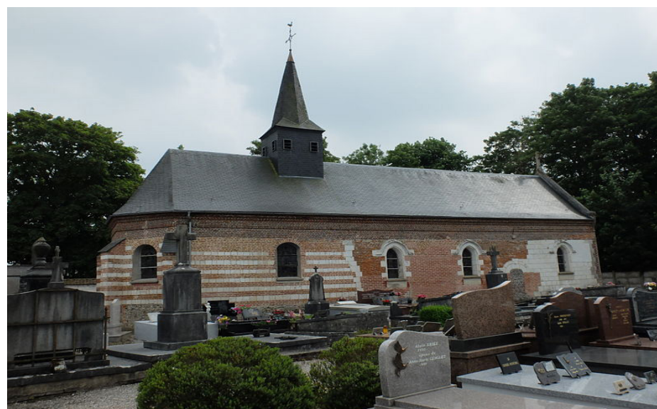
Eglise de Campigneulles les grandes