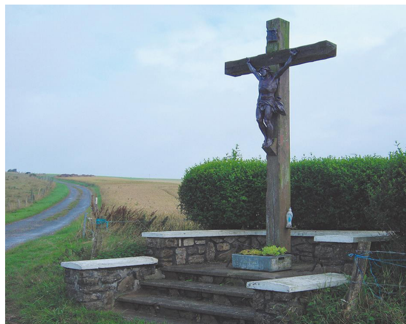
Calvaire de Widehem