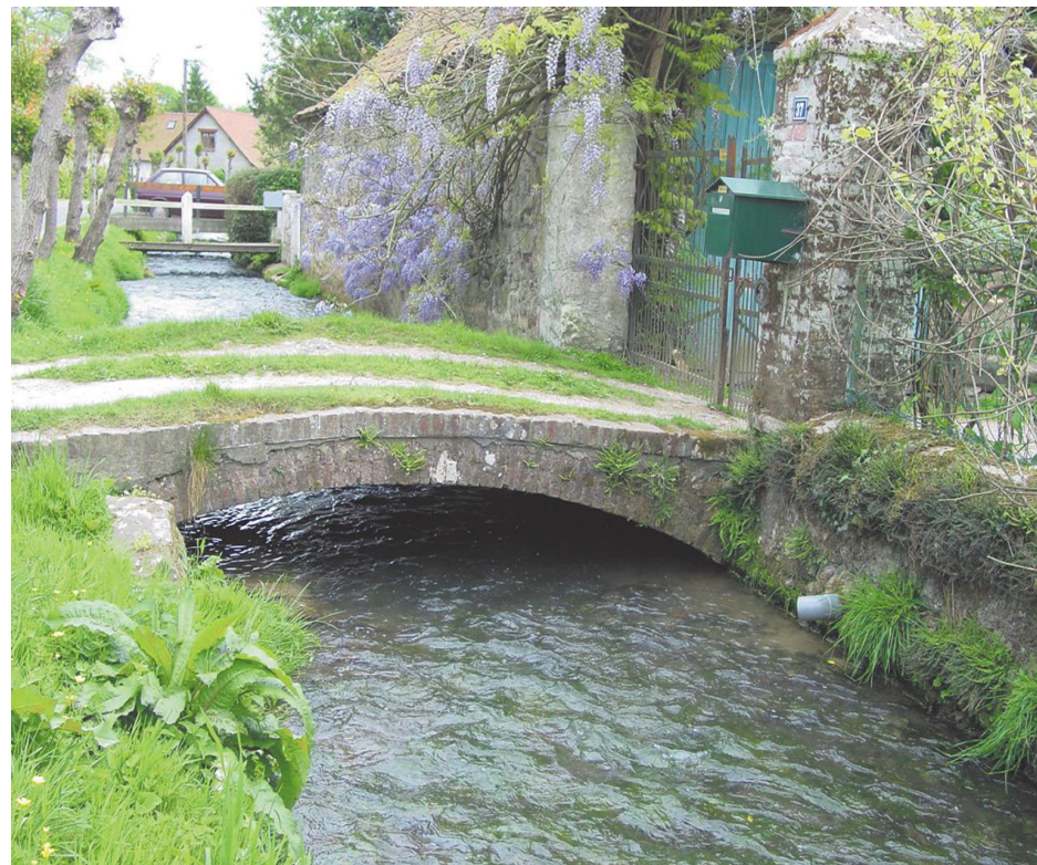
le Witrepin ou Huitrepin