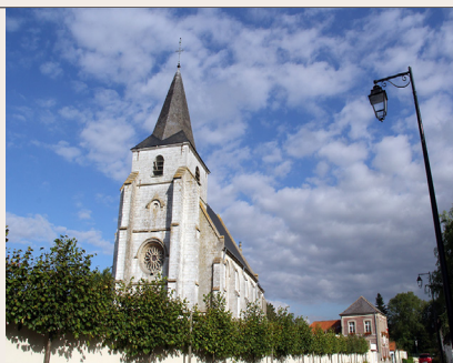
Église Wailly Beaucamp

L'église de Wailly Beaucamp Cette église dédiée à saint Pierre date du XVI ème siècle et fut restaurée vers 1883. La tour carrée remplace un clocher détruit en 1770 par une grosse tempête. Le clocher peut accueillir jusqu'à trois cloches, mais aujourd'hui une seule demeure datant de 1810 et dont le nom est Marie-Rose.