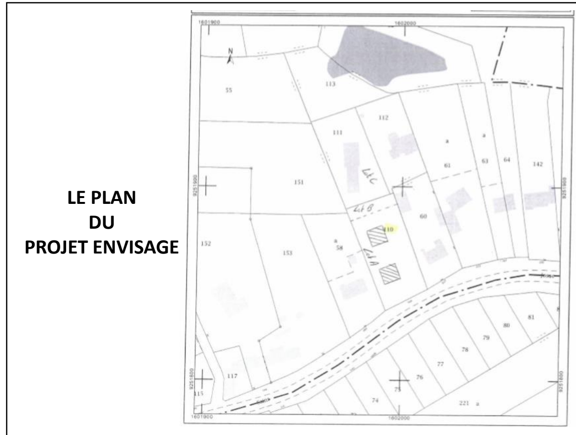
LE PLAN DU PROJET ENVISAGE

Fournir un plan donnant des précisions sur les constructions envisagées :