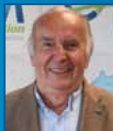
■ Walter KAHN Assainissement Eaux usées